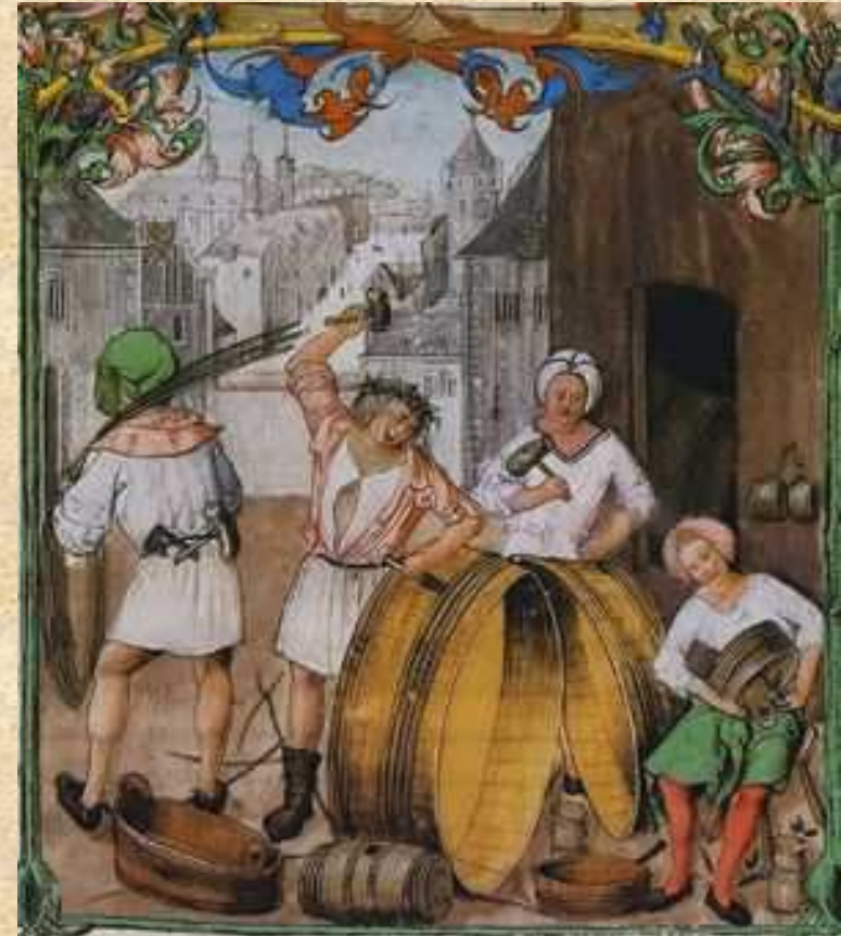
→ Warsztat bednarza