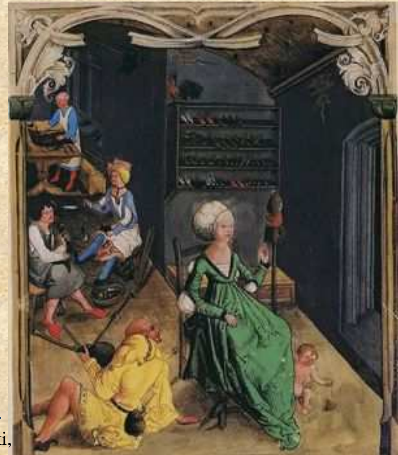
Zakład szewski, garbarnia